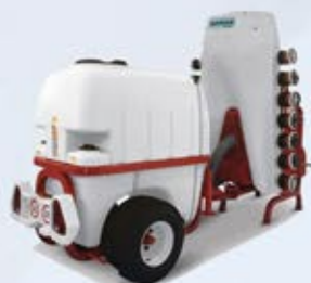
MULTI AIR SYSTEM