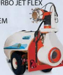
TURBO JET FLEX