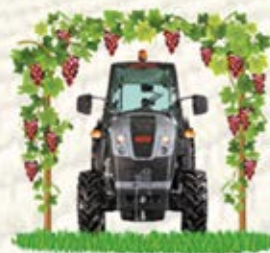
Vigneto Largo Basso