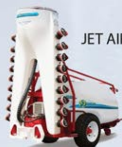
JET AIR SYSTEM