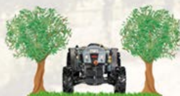
Frutteto Largo Basso