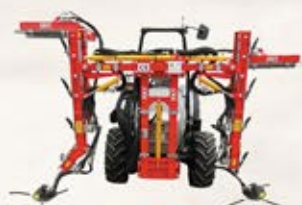
G800 / G850 / GDC800