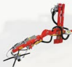
FL400U / FL410U